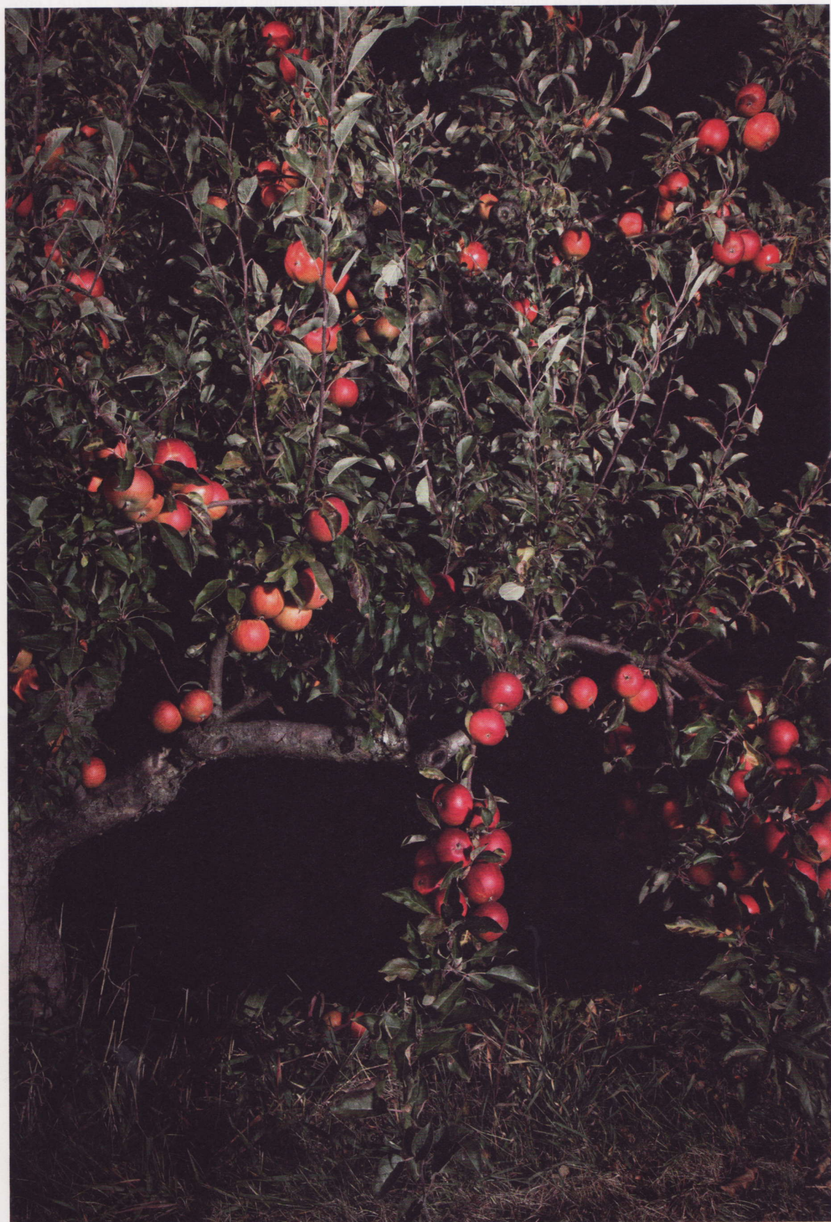
101 Duftige knallrote Äpfel – bedingt durch Wetters Pflege und kühle Weinviertler Nächte.