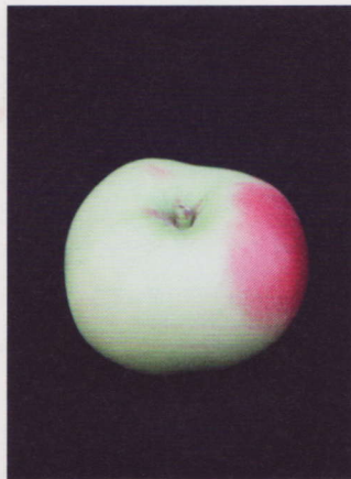
102 Kronprinz Rudolf, dem man den hervorragenden Geschmack nicht ansieht.

Aber reden wir doch zuerst einmal über Apfelsaft. Vergessen Sie bräunlich oxidierte, mit „fruchteigenen Restaurationsaromen“ beim Rückverdünnen angereicherte Konzentrate. Vergessen Sie metallisch, süß, fad, karamellig oder nach allem Möglichen, bloß nicht nach frischem Apfel schmeckenden Saft. Vergessen Sie Apfelsaftschorle und all die armseligen Durstlöcher unbekannter Herkunft. Denken Sie an den Biss in einen Apfel. Vergessen Sie auch den gleich wieder, wenn Ihr imaginiertes Apfel aus dem Supermarkt kommt. Denken Sie an Ihre Kindheit. An die letzten Ferientage. An die dem alten Apfelbaum durch mutiges Hinaufkraxeln und Herunterspringen abgetrotzten reifen, sonnenwarmen Früchte. Denken Sie an den Duft so eines Kindheits-spätsommerapfels, der in Ihrer Hand liegt. Und jetzt beißen Sie hinein. Knackig ist er. Saftig. Säuerlich. Moment, süß. Nein, säuerlich. Doch, süß! Sein würziges Aroma breitet sich im Mund aus, der Saft rinnt übers Handgelenk. Denken Sie an die befriedigende Erquickung, die Ihnen dieser Apfel einen Moment lang verschafft hat. Genau so schmeckt der Apfelsaft von Familie Wetter. Und das ist kein Zufall.